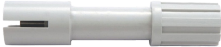
Eletrodo para controle de nível