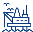
PLATAFORMAS DE PETRÓLEO