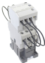
Para CT9 a CT40 For CT9 to CT40 CTC-9